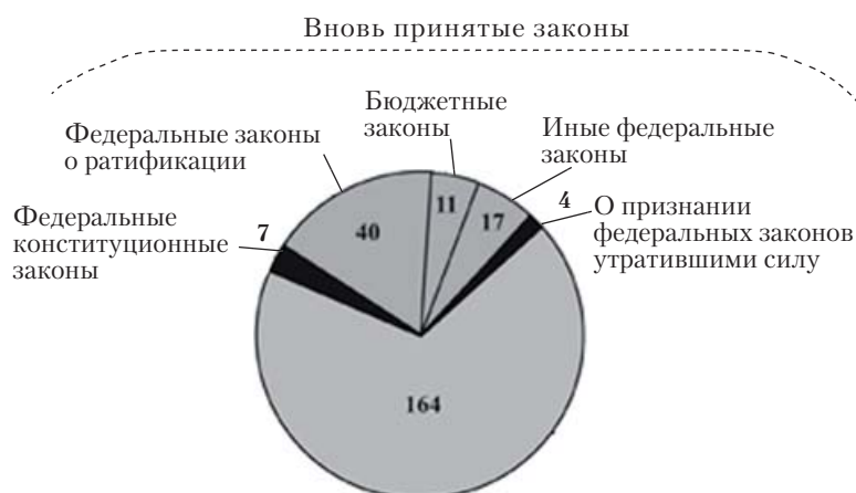
Рисунок. Разновидности и количество федеральных законов (2005 г.)

В федеральном законодательстве международный договор определяется как «международное соглашение, заключенное Российской Федерацией с иностранным государством или государствами либо с международной организацией в письменной форме (Здесь и далее курсив мой. – А. Е.) и регулируемое международным правом независимо от того, содержится такое соглашение в одном документе или в нескольких связанных между собой документах , а также независимо от его конкретного наименования » 5 . Это чрезвычайно важное определение нормативного правового акта с позиции документоведения. Кроме указания на документальную форму договора в нем подразумевается использование различных видов документов,